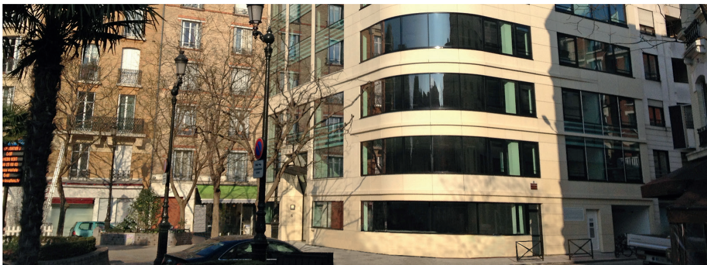
6/8, place Jean Zay - Levallois Perret (92)

Valable jusqu'à la parution du Bulletin n° 01 / 2019