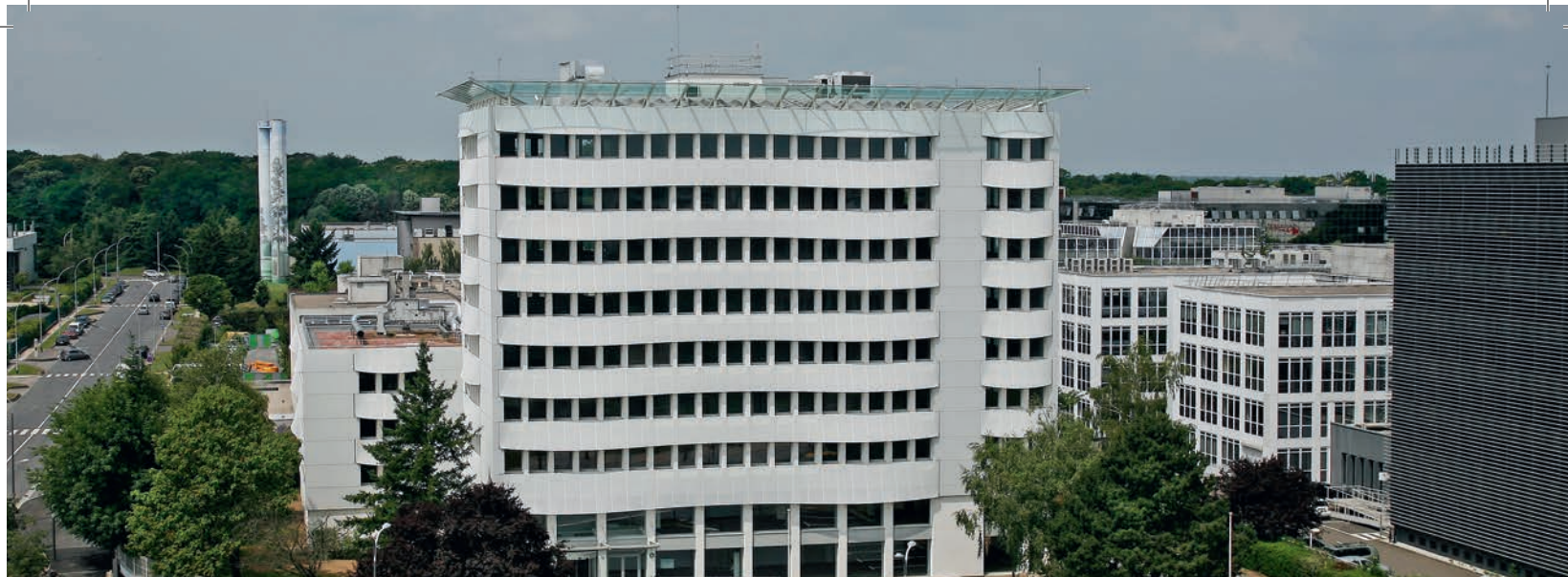
11, avenue Morane Saulnier - Vélizy (78)